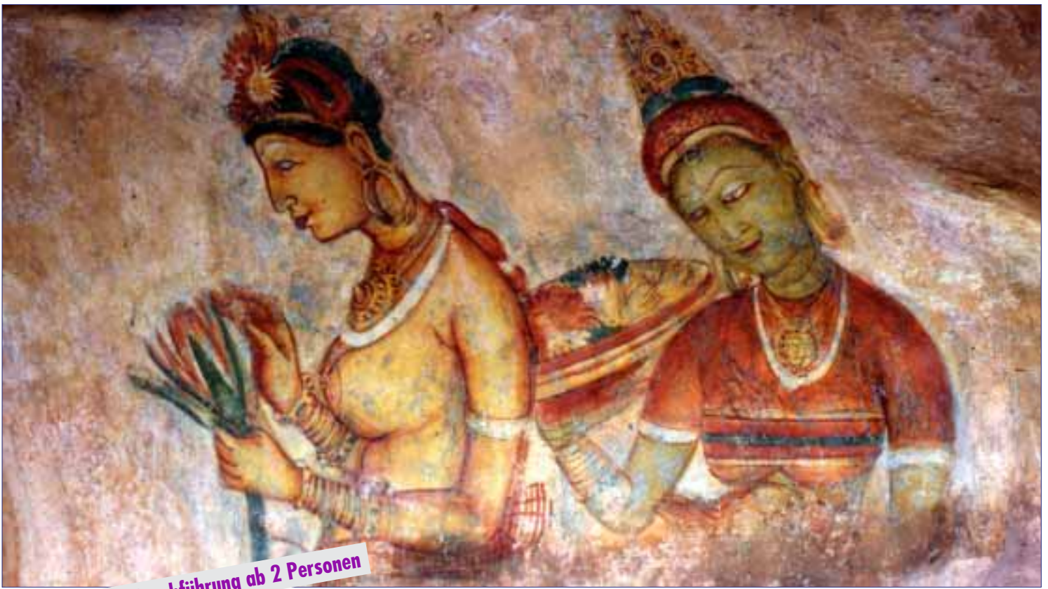
Sigiriya, Fresco „Wolkenmädchen“