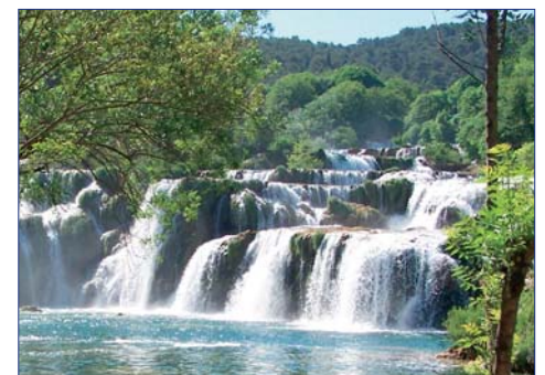
Wasserfälle im Nationalpark Krka

3. Tag (MO): KRKA-WASSERFÄLLE Fahrt zu den schönsten Kalksinter-Wasserfällen Europas im Nationalpark Krka. Wegen seiner natürlichen Schönheit wurde das Gebiet um den Karstfluss Krka, der am Fuße des Gebirgsstocks Dinarica entspringt, zum Nationalpark erklärt. Der Fluss besticht durch seine außerordentliche Schönheit mit Schluchten, Kaskaden, kristallklaren Seen und wundersamen Formen von glitzernden Wasserfällen. Die Wassermassen stürzen über 17 in kurzen Abständen aufeinanderfolgenden Travertinstufen in die Tiefe.