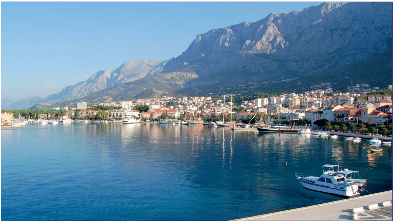
Blick vom Hotel Osejava auf Makarska