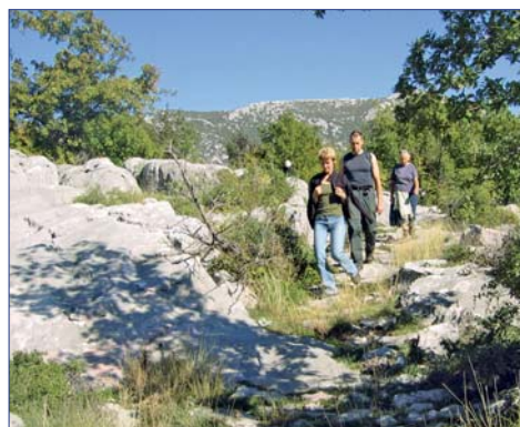
Das dalmatinische Hinterland

Nachmittags unternehmen Sie eine Bootsfahrt auf dem Fluss Cetina zu einer alten Mühle, wo 1962 Aufnahmen für die berühmten Winnetou-Filme gedreht wurden. F/M/A