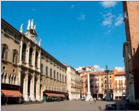
Vicenza, Piazza dei Signori

3. Tag: BASSANO DEL GRAPPA – Ausflug nach Padua Nach dem Frühstück starten Sie mit dem Bus Richtung Norden nach Padua. Es ist die Hauptstadt der Region Venetien und liegt in der gleichnamigen Provinz. Von Laubengängen eingefasste romantische mittelalterliche Gassen und architektonische Meisterwerke prägen das Stadtbild: die unter dem Staufer-Kaiser Friedrich II. 1238 erweiterte Universität, die Piazza Signori, die wunderbare Basilika del Santo mit byzantinischen Kuppeln, die Grabkirche Sant Antonio mit dem davorstehenden Reiterdenkmal des Gattamelata (übersetzt „gefleckte Katze“, wie im 15. Jh. ein Befehlshaber der Armee vom Volksmund benannt wurde), die Kapelle Scrovegni mit den einmaligen Giottofresken. Fahrt zu einem Bauernhof in der Nähe von Abano Terme und typisches Mittagessen mit Weinverkostung. Am Nachmittag Rückfahrt zu Ihrem Hotel. F/M/A