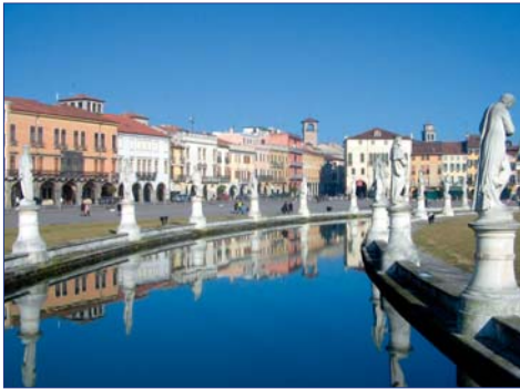
Padua, Prato della Valle

Per Schiff geht es nach Sirmione, auf der gleichnamigen Halbinsel gelegen. Wahrzeichen dieses Thermalbades ist die Scaligerburg (1259). Sie besichtigen die Grotten des Catull, benannt nach dem Dichter Catull (84.54 v. Chr.), römische Ruinen einer Villa und eines Thermalbades. Rückfahrt zu Ihrem Hotel. F/A