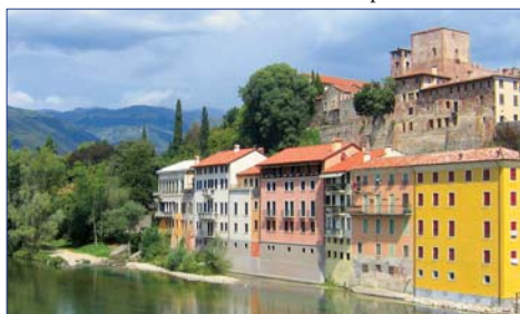
Bassano del Grappa

Am Nachmittag Fahrt zum Garda-See, der sich südlich des Alpenrades erstreckt und ein landschaftliches Juwel ist. In Gardone Riviera spazieren Sie durch den botanischen Garten und dann entlang der malerischen Seepromenade.