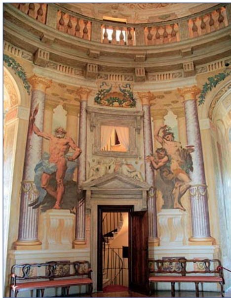
Vicenza, Villa Rotonda

5. Tag: BASSANO DEL GRAPPA – Ausflug nach VICENZA und BASSANO DEL GRAPPA Weiter nördlich am Rande der Po-Ebene und den Ausläufern der Alpen liegt Vicenza, die Stadt, die oft als „Venedig des Festlandes“ bezeichnet wird. Vicenza war Wirkungsstätte des großen Renaissance-Architekten Andrea Palladio (1508 – 1580). Als Hauptwerk Palladios gilt die zweigeschossige Basilika, keine Kirche, sondern ein Versammlungsort des Großen Rates an der Piazza dei Signori in der Altstadt. In unmittelbarer Nähe befindet sich die Loggia del Capitaniato, einst Sitz des venezianischen Staatshalters, ebenfalls von Palladio erbaut. Der gotische Dom aus rotem und weißen Marmor, dessen Kuppel Palladio schuf, und die romanische Kirche Santa Corona mit wunderbaren Gemälden von Bellini und Veronese gehören zu den schönsten Sakralgebäuden Vicenzas. Sie besichtigen das Teatro Olimpico, das erste überdachte Theater. Von nicht minderm Ruhm sind Profanbauten wie der Palazzo Chiericati mit dem städtischen Museum sowie die prächtigen Wohnsitze reicher Bürger, wie z.B. die Villa Rotonda. Nachmittags Rückfahrt nach Bassano del Grappa und Besichtigung eine der ältesten Grappa Destillieren der Region. Verkostung einiger Grappaschnäpse und anschließend Rückfahrt zu Ihrem Hotel. F/A