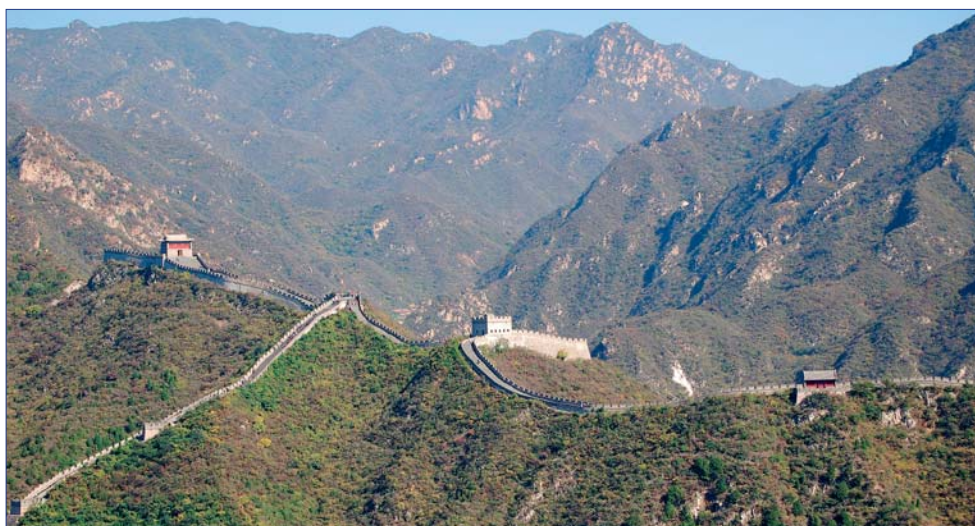
Große Mauer, Peking