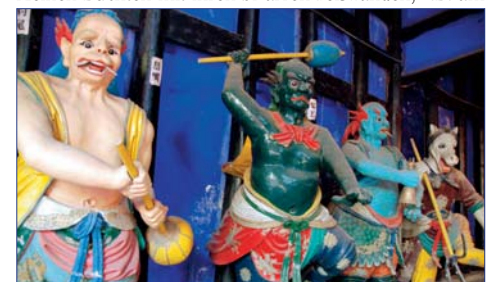
„Geisterstadt“ Fengdu am Yangtze

3. Tag SHANGHAI Der heutige Tag steht Ihnen zur freien Verfügung. F