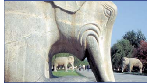
„Allee der Tiere“, Peking

Besonders eindrucksvoll ist die zur kaiserlichen Nekropole führende Geisterallee – im Volksmund „Allee der Tiere“ genannt. Auf der Rückfahrt nach Peking Besuch des Olympiapark-Geländes.