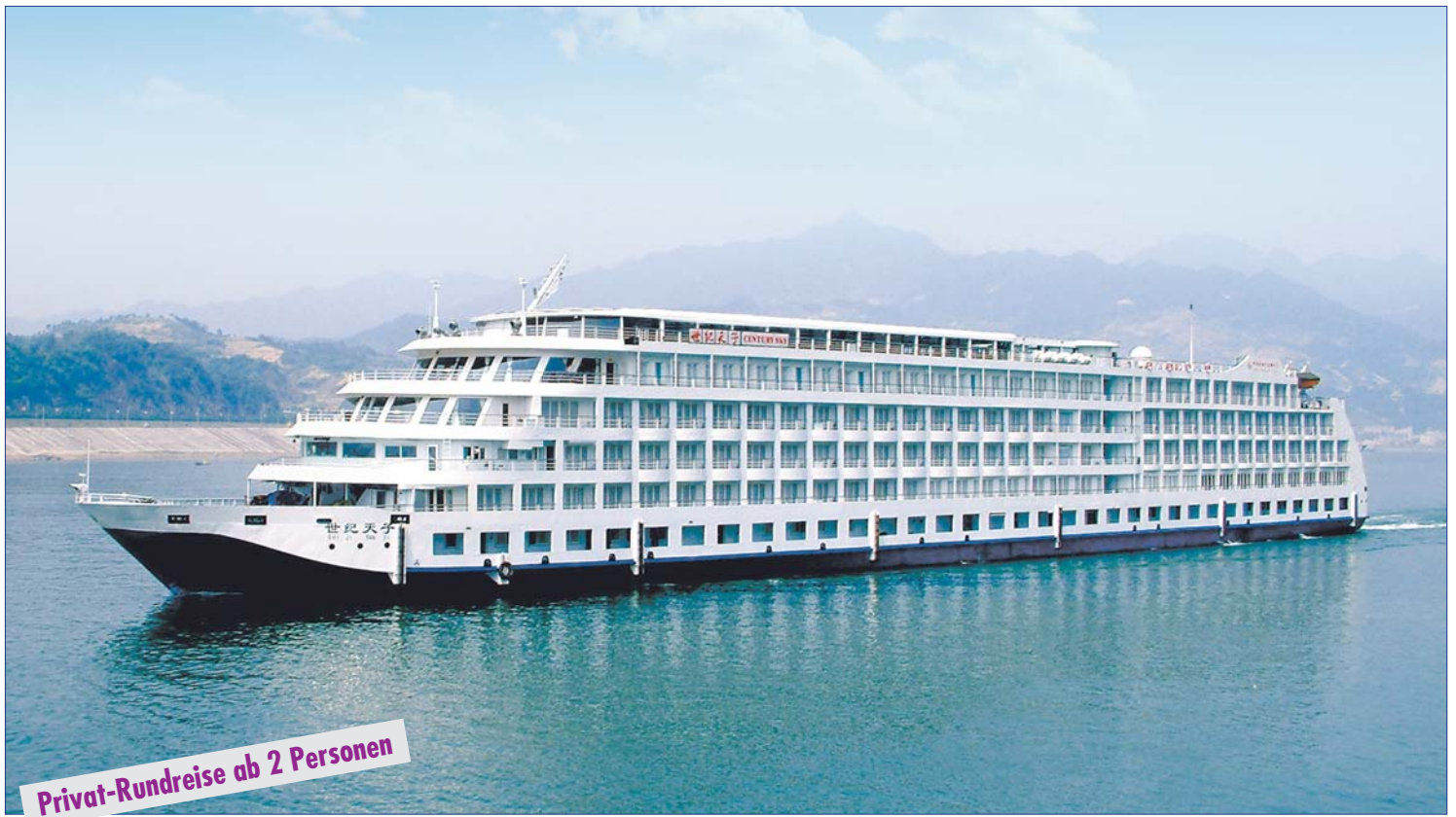
MS Century Sky