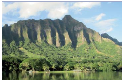
Hawaii, Oahu, Molii Fishpond

3. Tag: BANFF Der heutige Tag steht zur freien Verfügung. Erkunden Sie den Ort Banff auf eigene Faust oder nehmen Sie am fakultativen Ausflug zum Jasper Nationalpark teil (buchbar vor Ort). Sie fahren entlang des Icefield Parkway bis zum Eingang des Nationalparks. Mit dem Icefield Parkway erreichen Sie eine der spektakulärsten Panorama-