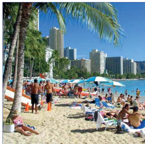
Waikiki Beach, Honolulu