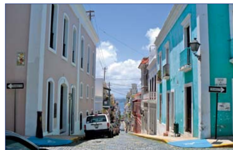
Puerto Rico, San Juan