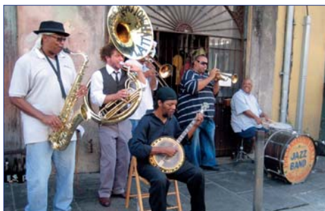
New-Orleans, Preservation Hall Jazz Band

Im Laufe des Nachmittags erreichen Sie dann Louisianas bekannteste Stadt, New Orleans. F