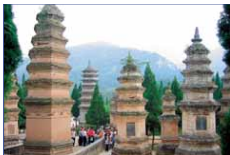
Pagodenwald beim Shaolin-Kloster.

Fakultativ: Besuch des Tiananmen-Platzes und des Himmels-Tempels. Der Platz des „Himmlichen Friedens“ wird im Norden vom Tor des Himmlichen Friedens, im Westen von der Volkskongresshalle, im Süden von der Mao-Zedong-Halle und im Osten vom Histori-